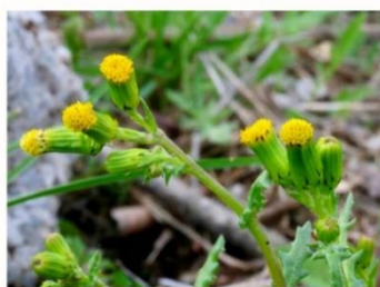
#45 - Klein kruiskruid Senecio vulgaris

Bestrijding: Een hardnekkige plant. Moeilijk te bestrijden, omdat de plant het hele jaar bloeit. Veel wieden. Pas op met de pluizenbolletjes. Bij een dicht gazon zal de plant zich daar moeilijk vestigen.