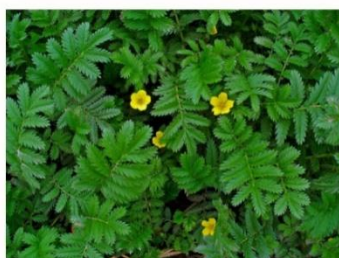
#46 - Zilverschoon Potentilla anserina

Bestrijding: Dit plantje overwoekert gras en daardoor ongewenst in het gazon. Door het gras veel te maaien kan je de plant uitputten. Andere methode is om de plant met wortel en al te verwijderen. Maar als de wortel breekt en er blijft een knoop achter kan hieruit weer een nieuwe plant groeien. Zilverschoon is een wortelonkruid.