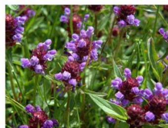
#47 - Brunel Prunella vulgaris

Bestrijding: Verwijder in het najaar alle planten handmatig. In de winter is de plant soms niet meer goed zichtbaar in het gazon.